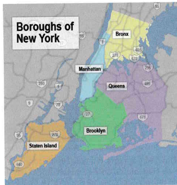
Zonele orașului New York

Marele oraș este împărțit în cinci zone: Manhattan, Staten Island, Bronx, Brooklyn și Queens. Manhattan este o insulă între două râuri: Hudson și East River. Râul Hudson separă Manhattan și Bronx de New Jersey, iar East River desparte Manhattan și Bronx de Long Island, adică de Brooklyn și Queens. Podurile sunt cele care fac legătura între diferitele zone ale orașului. Mai există și câteva insule mai mici, printre care Ellis Island, Governors Island, Liberty Island, Roosevelt Island.