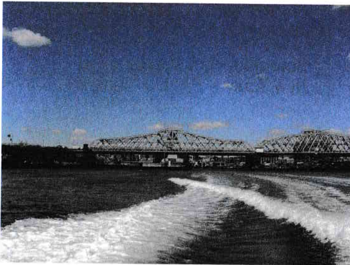
Willis Avenue Bridge (Podul Willis)

Plecăm din Stamford dimineața, pe autostradă însemnată pe hartă cu numărul 95. Conduce ginerele căruia îi place să conducă mașina și o conduce profesionist. Circulație fluentă. Trece peste râul Harlem, peste podul ce pare că saltă-n văzduh, numit Willis Avenue Bridge , inaugurat la sfârșitul secolului XIX și intrăm în nordul Manhattanului.