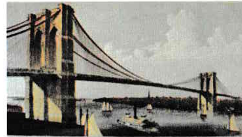
Brooklyn Bridge (Podul Brooklyn)

întinsă în balcoane. Zâmbesc, mă amuză observația mea banală, dar ea, gândesc, duce la concluzia că și omul sărac trăiește aici civilizată, beneficiază de tehnologia avansată a vremurilor în care trăim. Mă amuză deoarece îmi amintesc de vremurile trecute când nu oricine ieșea din țara noastră socialistă și la întrebarea: „Ce ați văzut interesant...?” adresată unei persoane de sex feminin, ce vizitase Parisul, aceasta ne-a răspuns: „Gogoși, dragilor, gogoși ca la noi în țară!” Eu nu îndrăznisem s-o întreb, deși îmi stătea pe limbă, dacă fusese o metaforă sau un adevăr, dar știu că pe tata l-a amuzat grozav răspunsul. S-a mulțumit și el numai cu râsul. Le spun copiilor și ei îmi răspund că nu trăiesc oameni săraci aici, ci o prosperă clasă de mijloc. Pesemne că