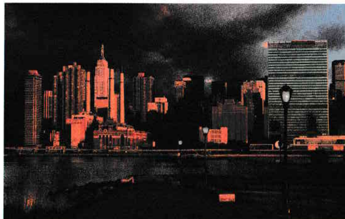
În partea dreaptă se vede clădirea sediului Națiunilor Unite, iar în partea stângă Empire State Building

O privesc și mă gândesc la rolul pe care îl au Națiunile Unite de a se implica în rezolvarea disputelor